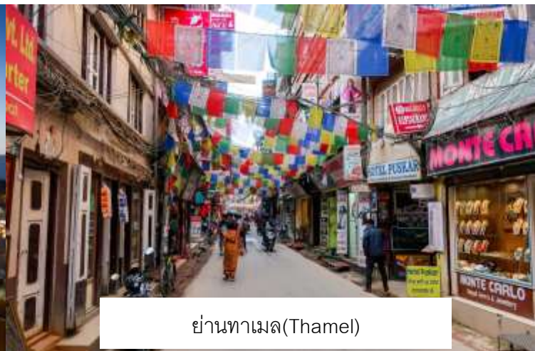
ย่านทามล(Thamel)