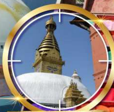
วัดสยมภูนารถ